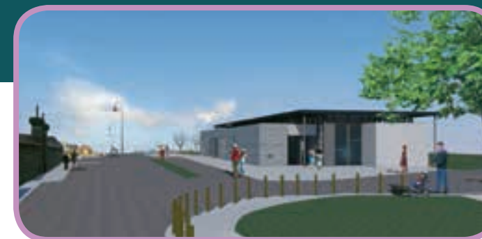
Future Médiathèque ➔