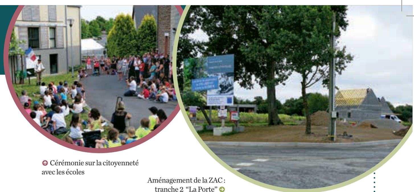
➔ Cérémonie sur la citoyenneté avec les écoles