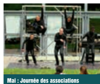
Mai : Journée des associations