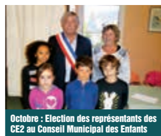
Octobre : Election des représentants des CE2 au Conseil Municipal des Enfants