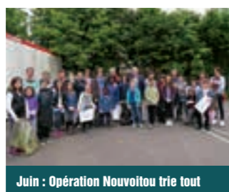
Juin : Opération Nouvoitou trie tout