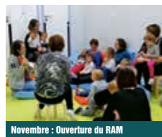
Novembre : Ouverture du RAM