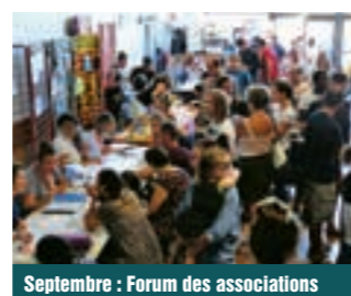
Septembre : Forum des associations