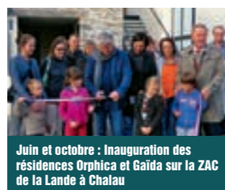
Juin et octobre : Inauguration des résidences Orphica et Gaïda sur la ZAC de la Lande à Chalais