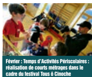
Février : Temps d'Activités Périscolaires : réalisation de courts métrages dans le cadre du festival Tous à Cinoche

Les animations à la Médiathèque, les expositions, les spectacles au Bocage, le repas des aînés, la Fête de Pâques, les commémorations, la braderie de livres de la médiathèque, la Fête de la Musique, l'opération argent de poche, la conférence de Luc Bienvenu sur le potager biologique, l'Accueil des nouveaux habitants, le marché de Noël...et toutes les manifestations associatives !