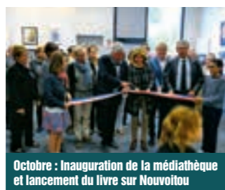
Octobre : Inauguration de la médiathèque et lancement du livre sur Nouvoitou