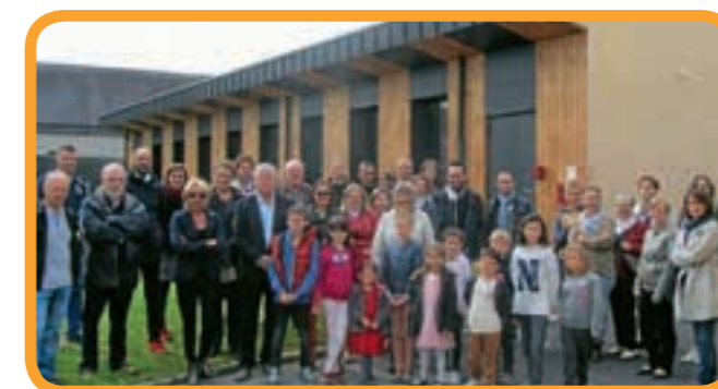
16 septembre : inauguration des travaux d'extension et d'aménagement de l'école