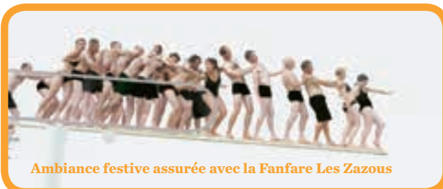
Ambiance festive assurée avec la Fanfare Les Zazous